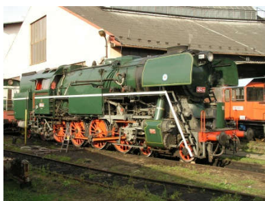
Parní lokomotiva řady 464.202 „Rosnička“, Závody V. I. Lenina, 1956.