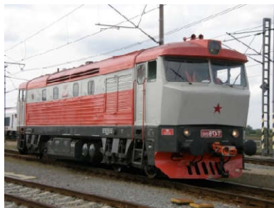
Motorová lokomotiva řady T 478, ČKD Praha, 1967.