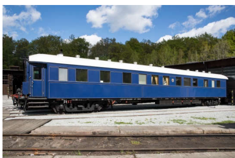
Salónní vůz Tomáše Garrigua Masaryka Aza 1-0080 a interiér, Ringhofferovy závody, 1930.