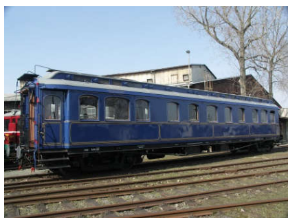
Salónní vůz Františka Ferdinanda d'Este Aza 1-0086 a interiér, Ringhofferovy závody, 1909.