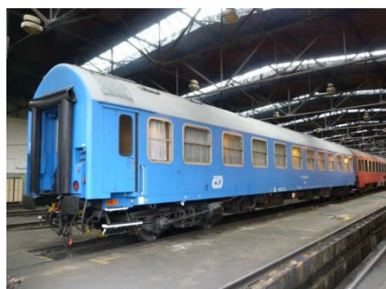
Salónní vůz Salon 001 (Aza 51 54 89-80 061-2; 51 54 89-80 001-8) a interiér, VEB Waggonbau Bautzen, 1968.